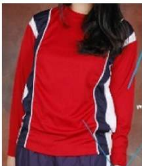
Kaos Olahraga Tangan Panjang