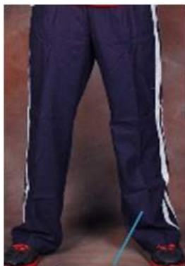
Celana Trening Panjang