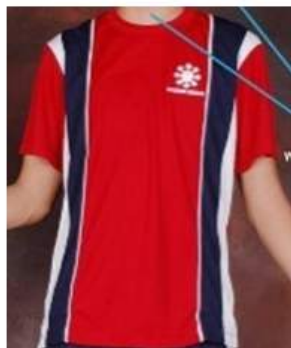
Kaos Olahraga Tangan Pendek